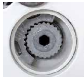
Bild 2: Durch Einfahren der Markise (1-2 cm) rutscht die Verzahnung ineinander.