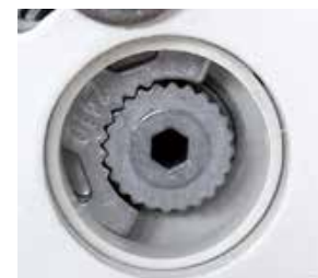
Bild 3: Die Verzahnung ist durch das Anziehen der Feststellschraube fixiert.