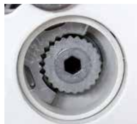
Bild 1: Die Verzahnung steht aufeinander.

► Beim Einstellen der Endlage kann es technisch bedingt dazu kommen, dass die Spitzen der Verzahnung aufeinander liegen. Daher muss die Verzahnung, durch Einfahren der Markise um 1 bis 2 cm entlastet werden.